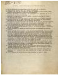
Plan Para La Reconstruccion De La Liga Puertorriqueña, Inc. / Plan for the Reconstruction of the Puerto Rican League, Inc. (JeCo_b16_f08_0020)