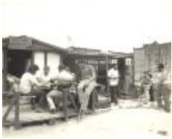
Welfare Social Club (CaOr_001)