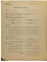
Reporte De Cada Visita (JeCo_b16_f14_0005)