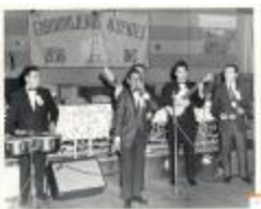
Performers at Caborrojeños Hometown Club (OGPRUS_MD_b12_fBe21-16_0002)