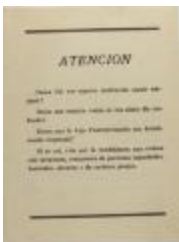
Liga Puertorriqueña E Hispana Candidates for Office (JeCo_b16_f11_0009_cover)