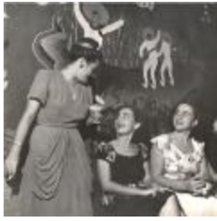
Social gathering (OGPRUS_OIPR_b3360_f20_0001)