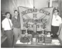
?Sociedad Cívica Sangermeños Ausentes / San Germán Hometown Club (SCSA_b01_f03_002)