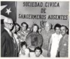
Sociedad Cívica Sangermeños Ausentes / San Germán Hometown Club (SCSA_b01_f03_001)