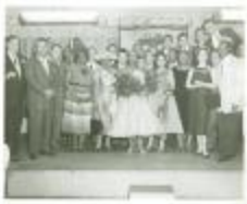
Salsa singer Celia Cruz (center) and party gathered onstage (JAMa_b09_f02_0003_front)