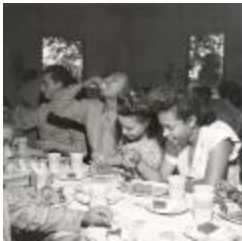
Club dinner scene (OGPRUS_OIPR_b3360_f36_0001)