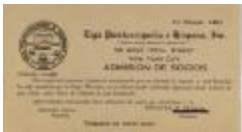
Liga Puertorriqueña - Admisión de Socios / Admission of Members (JeCo_b16_f11_0004_r)