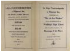
Día de las Madres / Mother's Day (JeCo_b16_f10_0026_cover)