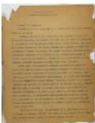
Empecemos de Nuevo / Let's Start Over (JeCo_b16_f11_0041_pg01)