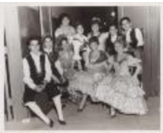
A group of young people dressed as "Gallegos" (JAMa_b25_f11_0001)