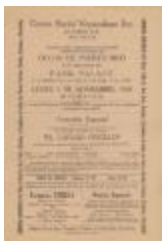
El Centro Social Venezolano Inc. (ErVa_b02_f06_0001)