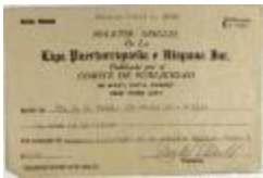
Advertising payment to Liga Puertorriqueña E Hispana (JeCo_b16_f11_0015)