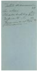
Manuscript notes by Liga Puertorriqueña, Inc. (JeCo_b16_f13_0001_pg01)