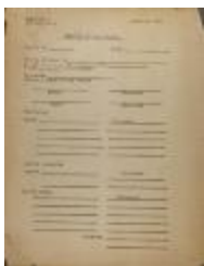
Reporte de Cada Visita / Report of Each Visit (JeCo_b16_f11_0039)