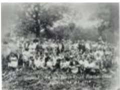
Segunda Jira Del Porto Rican Social Club / Second Tour of Porto Rican Social Club (JeCo_0111)