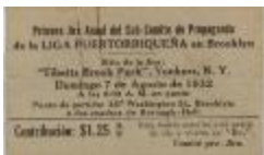
Liga Puertorriqueña First Annual Party (JeCo_b16_f10_0002)