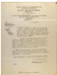
Correspondence from Jesús Colón (JeCo_b16_f10_0021)