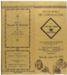
Gran Baile de Coronación / Great Coronation Dance (JeCo_b16_f10_0019)