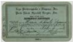
Liga Puertorriqueña E Hispana membership certificate (JeCo_b16_f08_0004_r)