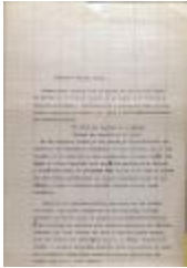
Juramento Ante El Ánfora / Oath Before the Amphora (JeCo_b16_f08_0022_pg01)