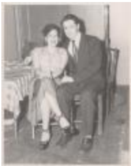
Night Club Scene (JAMa_b91_f04_0002)