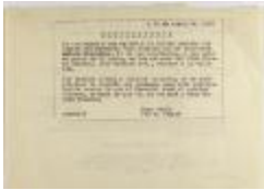
Convocatoria / Announcement (JeCo_b17_f07_0004_r)