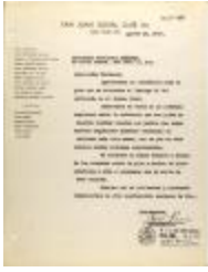
Correspondence from San Juan Social Club (JeCo_b19_f13_0043)