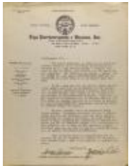
Correspondence from Liga Puertorriqueña E Hispana (JeCo_b16_f11_0025)