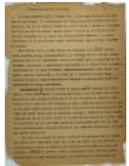
Próxima elección de Directiva / Next Board Election (JeCo_b16_f11_0047_pg01)