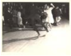
Jitterbugging in Harlem (CaOr_b20_f12_0009_front)