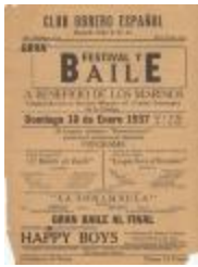
Club Obrero Español presents Gran Festival y Baile (ErVa_b02_f11_0001)