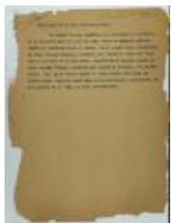
Escrutinio en la Liga Puertorriqueña / Scrutiny in la Liga Puertorriqueña (JeCo_b16_f11_0049)