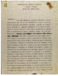
Conferencia Del Seminario Liberación (JeCo_b16_f07_0013_pg01)