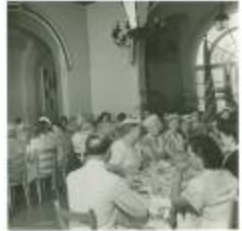
Club activities (OGPRUS_OIPR_b3360_f22_0001)