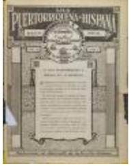
Liga Puertorriqueña E Hispana Oficial Boletín (JeCo_b16_f12_0001_cover)