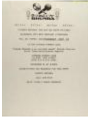
Comedy Rhumba (RiPe_b33_f07_0008)