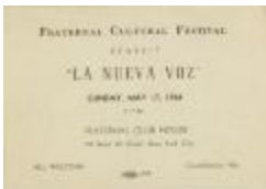
La Nueva Voz benefit (JeCo_b17_f17_0002_r)