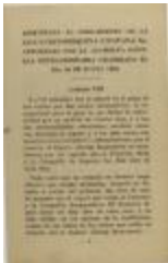
Enmiendas al reglamento de la Liga Puertorriqueña E Hispana, Inc., Aprobadas por la Asamblea General Extraordinaria celebrada el día 30 de Junio, 1929 (JeCo_b16_f11_0017_cover)