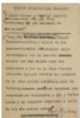
Patrio Guardián Del Claustro / Patriotic Guardian Of The Cloister (JeCo_b16_f08_0019_pg01)