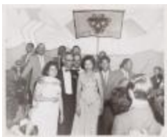
Members of the Inter-Americano Club Cubano (JAMa_b08_f05_0002)