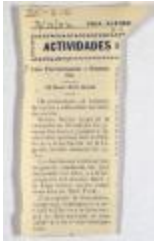
Actividades / Activities of Liga Puertorriqueña (JeCo_b16_f11_0013_pg01)