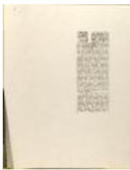
Liga Puertorriqueña E Hispana a Un Concierto / Liga Puertorriqueña E Hispana To a Concert (JeCo_b16_f11_0036)