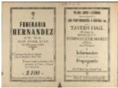
Liga Puertorriqueña E Hispana program (JeCo_b16_f11_0010_cover)