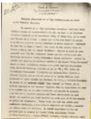
Banquete - Concierto de la Liga Puertorriqueña en honor a los Hermanos Figueroa / Banquet-Concert of the Puerto Rican League in honor of the Figueroa Brothers (JeCo_b16_f11_0037_pg01)