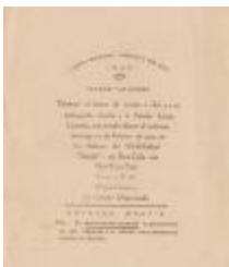
Invitation from the Logia Hispano America No.233 (ErVa_b02_f05_0003)