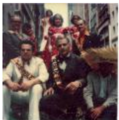
Sociedad Cívica Sangermeños Ausentes / San Germán Hometown Club (SCSA_b01_f02_001)