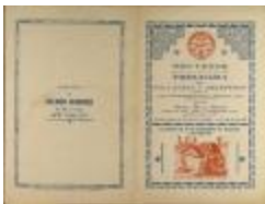
Liga Puertorriqueña - Souvenir y Programa Del Gran Baile Y Recepcion (JeCo_b16_f12_0006_cover)