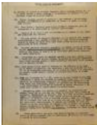
Primer Plan de Propaganda / First Propaganda Plan (JeCo_b16_f11_0026_pg01)