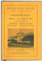
Grandioso Baile / Grand Dance (JeCo_b22_f08_0001_front)