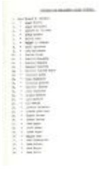
Sociedad de Caballeros - Lista Oficial / Society of Gentleman -Official List (MaSa_b_f_Vol III_0003)