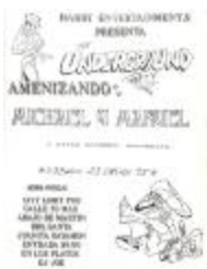
The Underground Party (RoSt_0008)