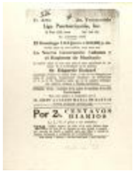
La Nueva Generación Cubana y El Régimen de Machado / The New Cuban Generation and Machado's Regime (JeCo_b16_f08_0014)