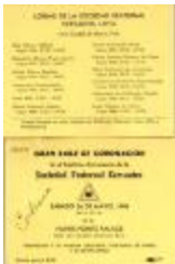
Gran Baile de Coronación / Great Ball Coronation (JeCo_0087)