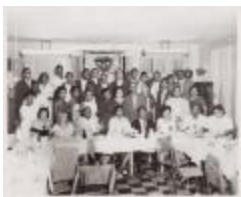
The New York Inter-Americano Club Cubano (JAMa_b08_f05_0001)