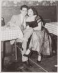
Night Club Scene (JAMa_b91_f04_0001)