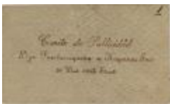
Comité de Publicidad / Advertising Committee (JeCo_b16_f10_0001)