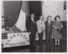
The Peruvian Club Cuzco (JAMa_b18_f03_0001)