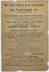
Liga Puertorriqueña E Hispana program (JeCo_b16_f08_0001)