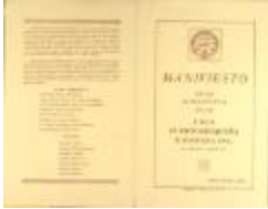
Manifiesto de la Directiva de la Liga Puertorriqueña E Hispana / Manifiesto of the Direction of the Liga Puertorriqueña E Hispana (JeCo_b16_f11_0002_cover)