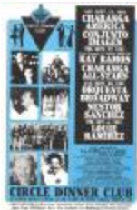
Ray Ramos concert flyer (RaRa_0051_pg28)