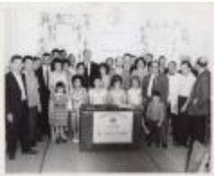
Members of Organización Hijos de Jayuya, Inc. (JAMa_b44_f05_0001)