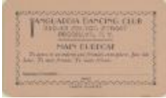
Vanguardia Dancing Club membership card (JeCo_b20_f01_0005_r)