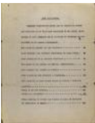
Para Referencia / For Reference (JeCo_b16_f11_0033_r)