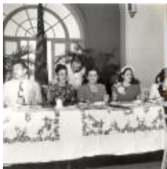
Banquet dinner (OGPRUS_OIPR_b3360_f24_0001)