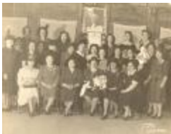
Auxiliary Women League (CaFr_b_f_ Auxiliary Women League)