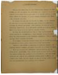
Nuestro Concurso / Our Contest (JeCo_b16_f11_0043)