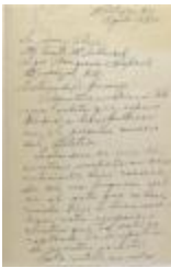
Correspondence from Emilia Colón (JeCo_b16_f14_0001_pg01)