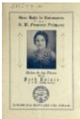
Gran Baile de Coronacion de S.M. Frances Rivera (JeCo_b16_f11_0008_cover)