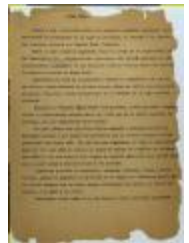
Una Jira (JeCo_b16_f11_0048)