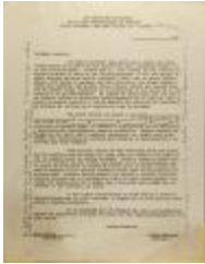
Correspondence from Liga Puertorriqueña (JeCo_b16_f14_0006)