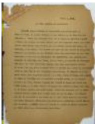
La Liga celebra un escrutinio / La Liga holds a scrutiny (JeCo_b16_f11_0045_pg01)