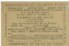
Conmemoración Del Día de las Madres / Commemoration of Mother's Day (JeCo_b16_f10_0003_r)