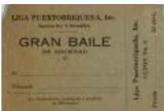
Liga Puertorriqueña invitation to Gran Baile (JeCo_b16_f08_0006_r)