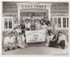
Members of Sociedad Voluntad Caritativa, Inc. (JAMa_b89_f01_0001)