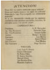
Candidates for Office in Liga Puertorriqueña (JeCo_b16_f10_0007_r)