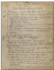
Propaganda Pro. Hogar de la Liga Puertorriqueña Hispana / Propaganda Pro. Home of the Liga Puertorriqueña Hispana (JeCo_b16_f11_0021)