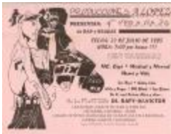
4th Veranazo de Rap y Reggae (RoSt_0007)