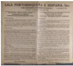
Liga Puertorriqueña E Hispana (JeCo_b16_f11_0034_pg01)