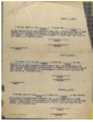
Advertiser agreement with Liga Puertorriqueña (JeCo_b16_f08_0011)