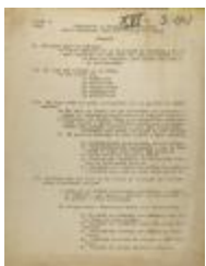
Sub-Comité de Propaganda de Brooklyn - Sumario / Summary (JeCo_b16_f14_0003_pg01)