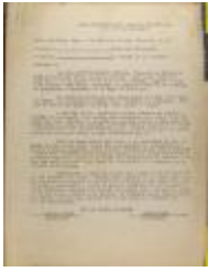
Correspondence from Liga Puertorriqueña E Hispana (JeCo_b16_f11_0050)