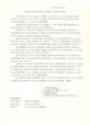
Informe (Presidente Sociedad de Caballeros) / Inform (Society of Gentlemen President) (MaSa_b_f_Vol III_0004)