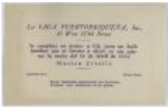
Liga Puertorriqueña invitation (JeCo_b16_f08_0003)