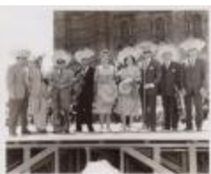
Puerto Rican Social Gathering (JAMa_b85_f07_0001)