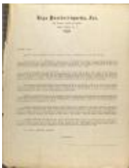
Correspondence from Liga Puertorriqueña (JeCo_b16_f08_0023)