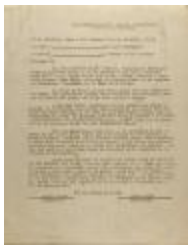
Liga Puertorriqueña Hispana Incorporada (JeCo_b16_f14_0007)