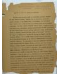
Celebró La Liga Una Velada De Brooklyn / The Liga Celebrated a Brooklyn Evening (JeCo_b16_f11_0044_pg01)