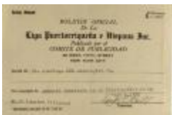
Advertising pay statement to Liga Puertorriqueña (JeCo_b16_f11_0016)