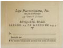
Liga Puertorriqueña invitation to Banquete-Baile (JeCo_b16_f08_0005)