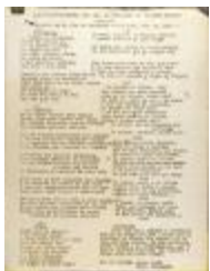
Recuerdo de la Jira de Hecksher State Park (JeCo_b16_f10_0025_pg01)