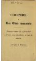
Coopere a Una Obra Necesaria / Cooperate to a Necessary Work Protect yourself against the disease and protect your families in case of death. read what interests you (JeCo_b16_f11_0011_cover)