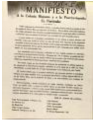
Manifiesto: A la Colonia Hispana y la Puertorriqueña En Particular / Manifiesto: To the Hispanic and the Puerto Rican Colony in Particular (JeCo_b16_f11_0035)