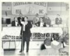
Caborrojeños Hometown Club (OGPRUS_MD_b12_fBe21-16_0001)