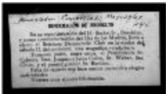
Informacion de Brooklyn / Information of Brooklyn (JeCo_b01_f06_0184)