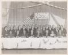
The Casa Galicia 25th Anniversary (JAMa_b24_f06_0001)