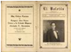
El Boletín (JeCo_b16_f09_0001_pg01)