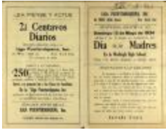
Liga Puertorriqueña's Día de Las Madres / Mother's Day program (JeCo_b16_f08_0012_pg01)