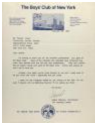
Correspondence from the Boys' Club of New York (RiPe_b28_f10_0003)