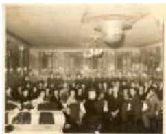
Fragoza and American Legion members and their families (CaFr_b_f_ American Legion and family gathering)